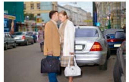
> Voor jonge, rijke Russen is het centrum van Moskou een speelplaats