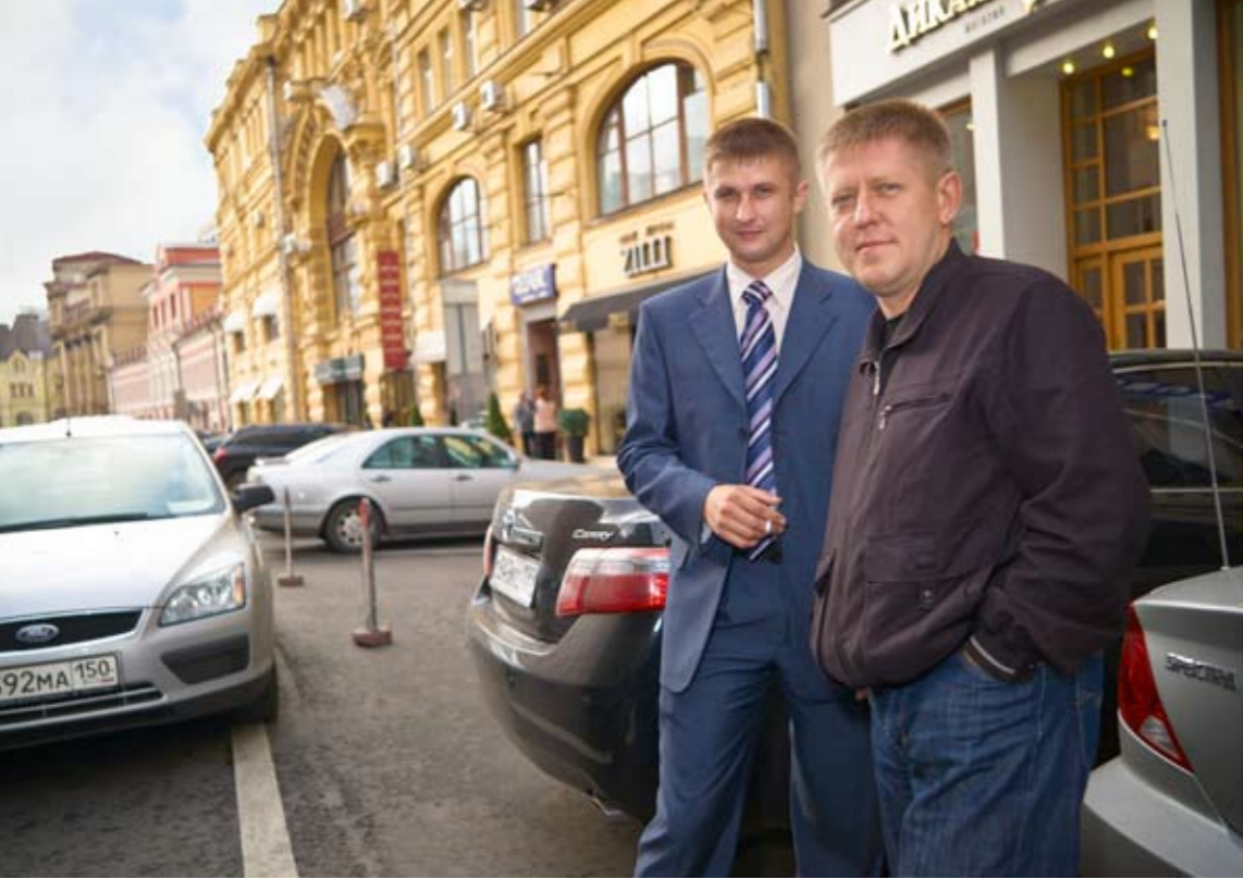
> Privéchauffeurs wachten op hun baas bij een pasgeopende Cartier-winkel